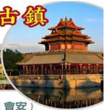
一座活生生的歷史博物館 { 會安 }

像是披上鮮亮色彩的中國小村子，鄰近還有充滿詩意的秋盤河，蜿蜒古城與河畔，讓您隨著慵懶的步調感受體驗文明的樂活人生於 1999 年被世界文教組織認定為『世界文化遺產』。